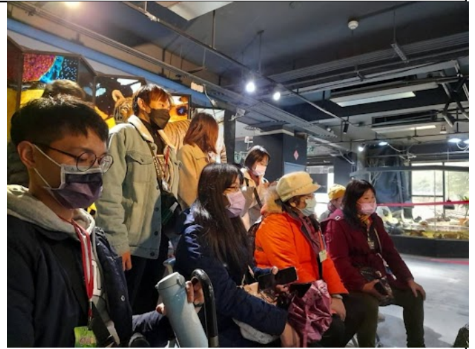
參與人員從互動體驗中學習發現