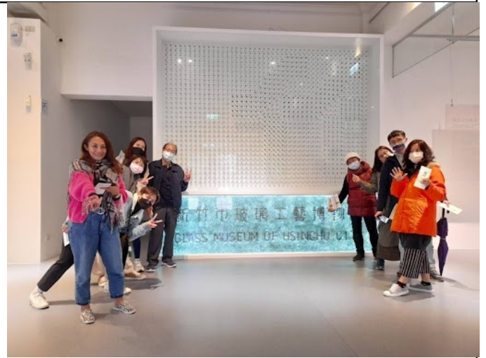
參訪玻璃工藝博物館