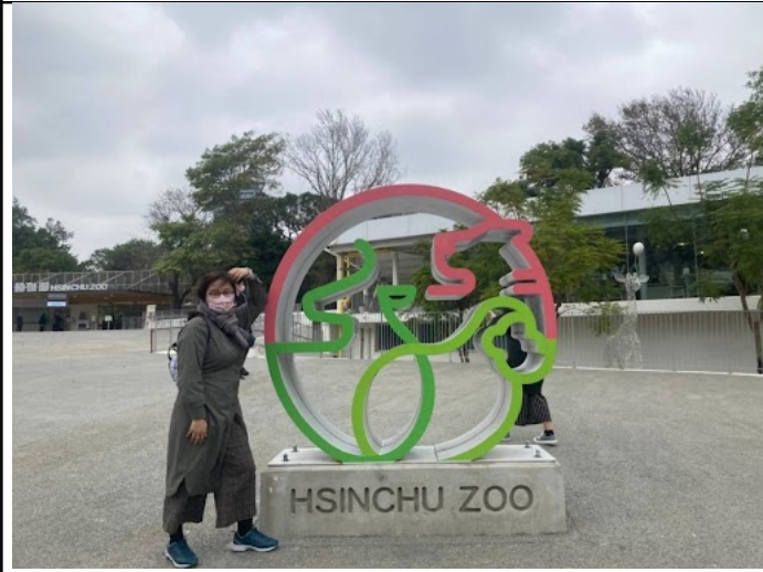
參訪新竹市立動物園