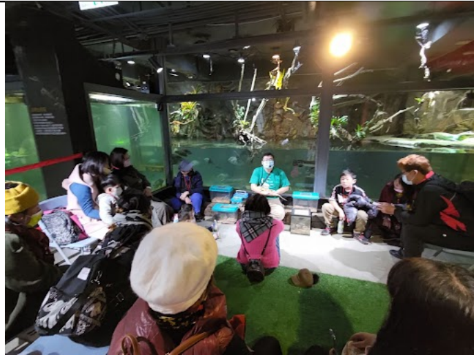
外聘講師進行昆蟲體驗導覽