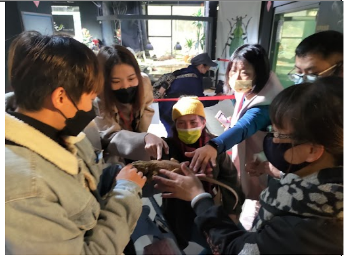
近距離接觸動物，學習同理