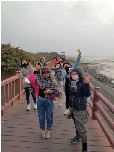
香山濕地藝術結合社區藝術