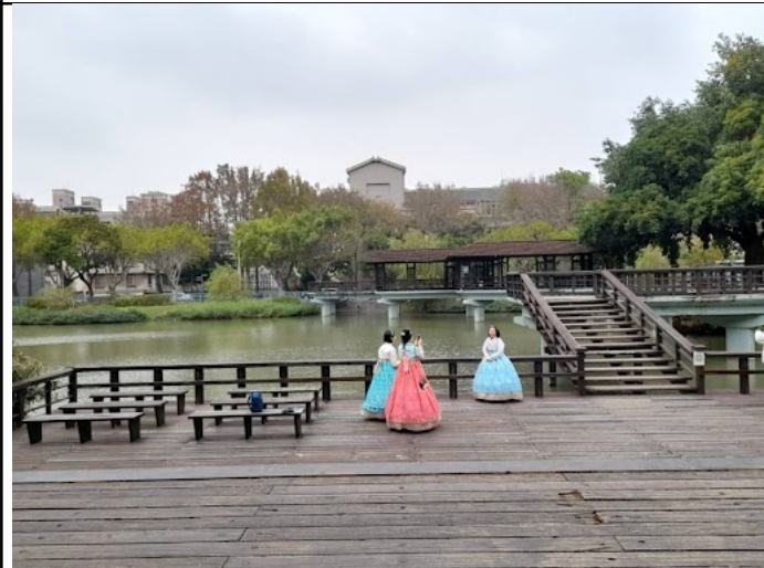
新竹公園展示光雕作品